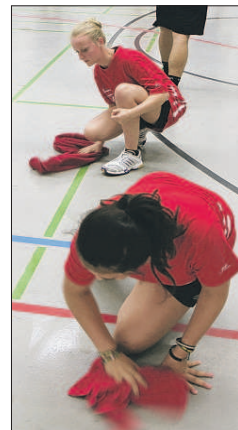
Fleißige Helfer: Immer wieder musste gewischt werden.