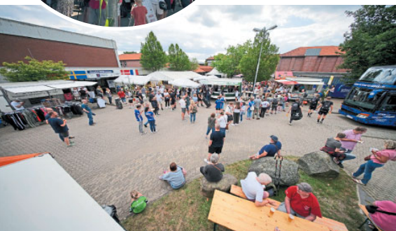
Im Außenbereich der KGS-Halle ist für Kurzweil gesorgt.