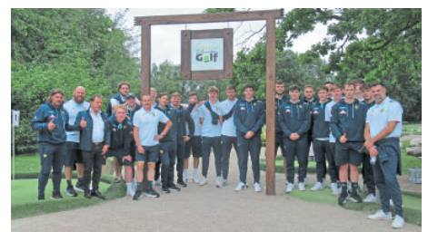
Die Rhein-Neckar Löwen sind zu Gast beim Schnucken-Golf.