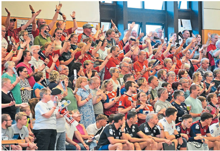
Vor allem die Fans des HSV Hamburg sorgen für Stimmung in der KGS-Halle.